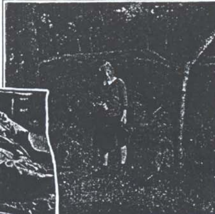
ALLAS VÅR LYDDE